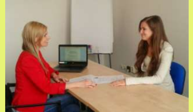
Poradenství s HR specialistou