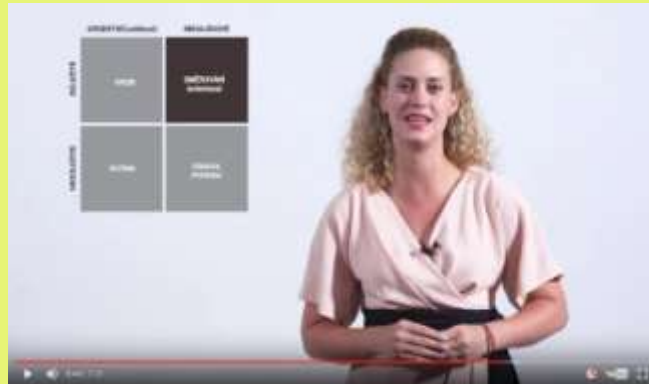
E - learning